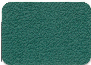
2016 シルバーグリーン